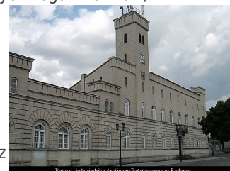
Ratusz - bryła siedziby Archiwum Państwowego w Radomiu.

Obecnie każdego dnia w południe wygrywa on uroczysty hejnał - melodię skomponowaną przez najwybitniejszego kompozytora polskiego średniowiecza Mikołaja z Radomia.