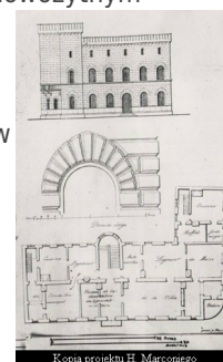
Kopia projektu H. Marconiego

Już w trakcie prac budowlanych trwających w latach 1845-1848 dokonano licznych korekt i uzupełnień architektonicznych, których autorami byli budowniczy miejscy. W efekcie powstał obiekt o bardzo interesującej, a dla ówczesnego Radomia wręcz wyjątkowej, architekturze: prostej w formie, ale równocześnie zawierający wiele detali zaczerpniętych z gotyku i wczesnego odrodzenia włoskiego. Przez kolejnych kilkadziesiąt lat pełnił on z powodzeniem funkcję siedziby władz miasta, a także odwachu policyjnego, urzędu poboru rekruta i innych struktur administracyjnych. Postępujący rozwój demograficzny i gospodarczy Radomia, połączony ze wzrostem infrastruktury miejskiej, a tym samym zadań spoczywających na pracownikach magistratu, sprawił jednak, że w początkach XX wieku ratusz okazał się obiektem zbyt ciasnym dla organów municypalnych.