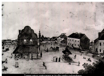
Dawny ratusz usytuowany w śródmieściu radomskiego

Siedzibą Archiwum Państwowego w Radomiu w latach 1963-2013 roku był jeden z najciekawszych zabytkowych obiektów architektonicznych na obszarze starówki - gmach dawnego ratusza miejskiego. Historia tego obiektu sięga początków XIX w., kiedy to władze miejskie przeprowadziły rozbiórkę dawnej siedziby magistratu, usytuowanej w centrum radomskiego rynku.