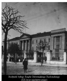
Budynek byłego Rządu Gubernialnego Radomskiego (XX-lecie niepodległości)

Historia Archiwum Państwowego w Radomiu jest związana ściśle z dziejami placówek archiwalnych, istniejących w mieście w XIX i pierwszych dziesięcioleciach XX wieku. W źródłach staropolskich notowane jest archiwum grodzkie, mieszczące się w odrestaurowanej części radomskiego zamku. Komórki zajmujące się przechowywaniem dokumentów istniały również w strukturach licznych urzędów i instytucji, mających siedziby w Radomiu w okresie przynależności miasta do monarchii austriackiej i dobie Księstwa Warszawskiego. W 1816 r. Radom uzyskał rangę stolicy województwa sandomierskiego, zarządzanego przez komisję o tej samej nazwie. Komisja Województwa Sandomierskiego posiadała sprawnie funkcjonujące archiwum, czego świadectwem jest m.in. instrukcja z 1821 r., omawiająca zasady prowadzenia tej placówki oraz tryb przekazywania do niej akt. W późniejszych latach, w związku ze zmianami administracyjnymi, gromadzeniem,