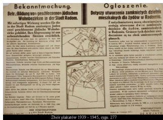
Poster plakatuw 1939 - 1945, pp. 277

Inne. Dużą wagę informacyjną dla badań nad postawami politycznymi naszych antenatów posiadają akta wyborcze, w tym materiały komisji powiatowych z wyborów do pierwszej, rosyjskiej Dumy Państwowej. Jeszcze chętniej wykorzystywane są zbiory i kolekcje.