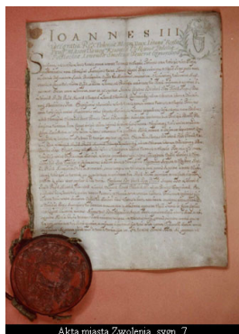
Akta miasta Zwoleń, sygn. 7

Administracja samorządowa. Wśród akt wytworzonych przez administrację samorządową na uwagę zasługują przede wszystkim akta miast. Największy objętościowo zespół to Akta miasta Radomia . Bogactwo zachowanych tutaj materiałów, począwszy od protokołów posiedzeń ciał kolegialnych, aż po akta ewidencji ludności sprawia, iż dokumentują one niemalże wszystkie aspekty życia ośrodka w XIX i XX w.