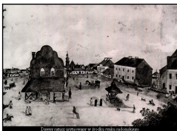
Dawny ratusz usytuowany w środku rynku radomskiego

Siedzibą Archiwum Państwowego w Radomiu w latach 1963-2013 roku był jeden z najciekawszych zabytkowych obiektów architektonicznych na obszarze starówki - gmach dawnego ratusza miejskiego. Historia tego obiektu sięga początków XIX w., kiedy to władze miejskie przeprowadziły rozbiórkę dawnej siedziby magistratu, usytuowanej w centrum radomskiego rynku.