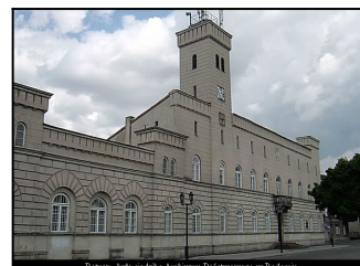
Ratusz - bryła neobarokowa Archiwum Państwowego w Radomiu

Obecnie każdego dnia w południe wygrywa on uroczysty hejnał - melodię skomponowaną przez najwybitniejszego kompozytora polskiego średniowiecza Mikołaja z Radomia.