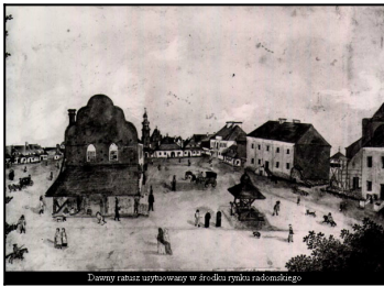
Dawny ratusz usytuowany w środku rynku radomskiego.

Siedzibą Archiwum Państwowego w Radomiu w latach 1963-2013 roku był jeden z najciekawszych zabytkowych obiektów architektonicznych na obszarze starówki - gmach dawnego ratusza miejskiego. Historia tego obiektu sięga początków XIX w., kiedy to władze miejskie przeprowadziły rozbiórkę dawnej siedziby magistratu, usytuowanej w centrum radomskiego rynku.