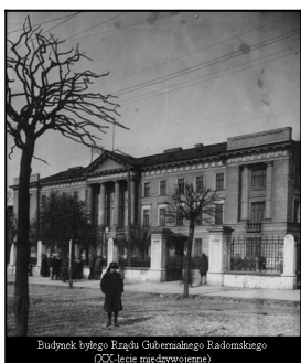
Budynek byłego Rządu Gubernialnego Radomskiego (XX-lecie niepodległości)

Historia Archiwum Państwowego w Radomiu jest związana ściśle z dziejami placówek archiwalnych, istniejących w mieście w XIX i pierwszych dziesięcioleciach XX wieku. W źródłach staropolskich notowane jest archiwum grodzkie, mieszczące się w odrestaurowanej części radomskiego zamku. Komórki zajmujące się przechowywaniem dokumentów istniały również w strukturach licznych urzędów i instytucji, mających siedziby w Radomiu w okresie przynależności miasta do monarchii austriackiej i dobie Księstwa Warszawskiego. W 1816 r. Radom uzyskał rangę stolicy województwa sandomierskiego, zarządzanego przez komisję o tej samej nazwie. Komisja Województwa Sandomierskiego posiadała sprawnie funkcjonujące archiwum, czego świadectwem jest m.in. instrukcja z 1821 r., omawiająca zasady prowadzenia tej placówki oraz tryb przekazywania do niej akt. W późniejszych latach, w związku ze zmianami administracyjnymi, gromadzeniem,